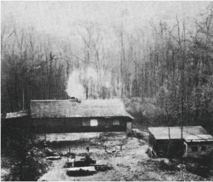
NFH Fuchsrain im Urzustand. Vom Schuttfeld einer Schießbahn zum Stadtheim mit Musikpavillon und Freilichtbühne