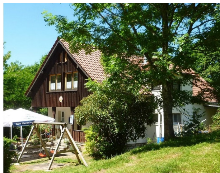
Das Naturfreundehaus Sechselberg