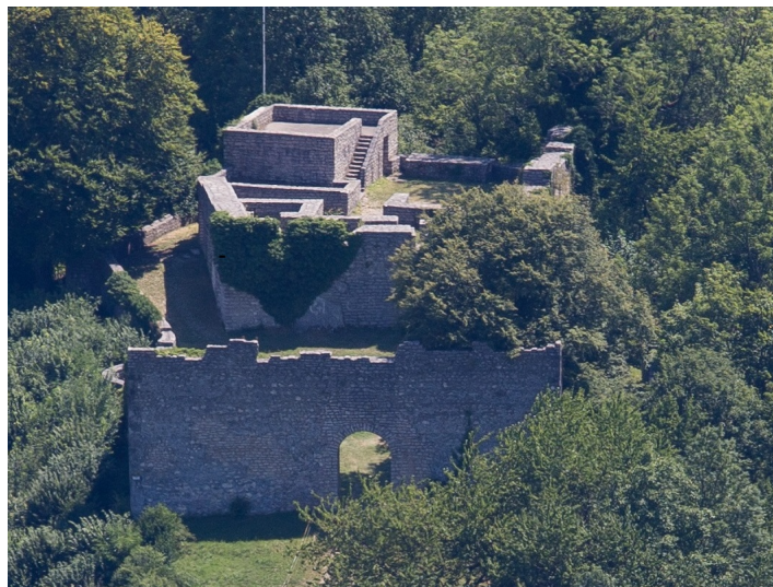
Burg Sulzburg im Lautertal