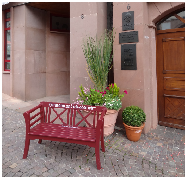
Wo Hermann Hesse einst wohnte