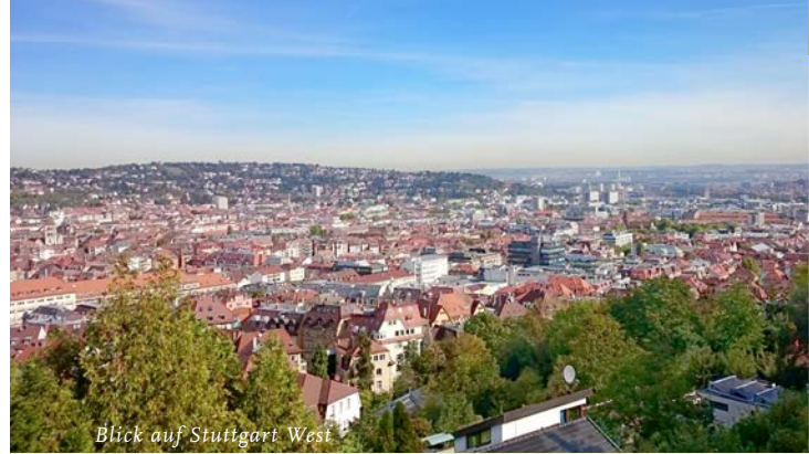
Blick auf Stuttgart West